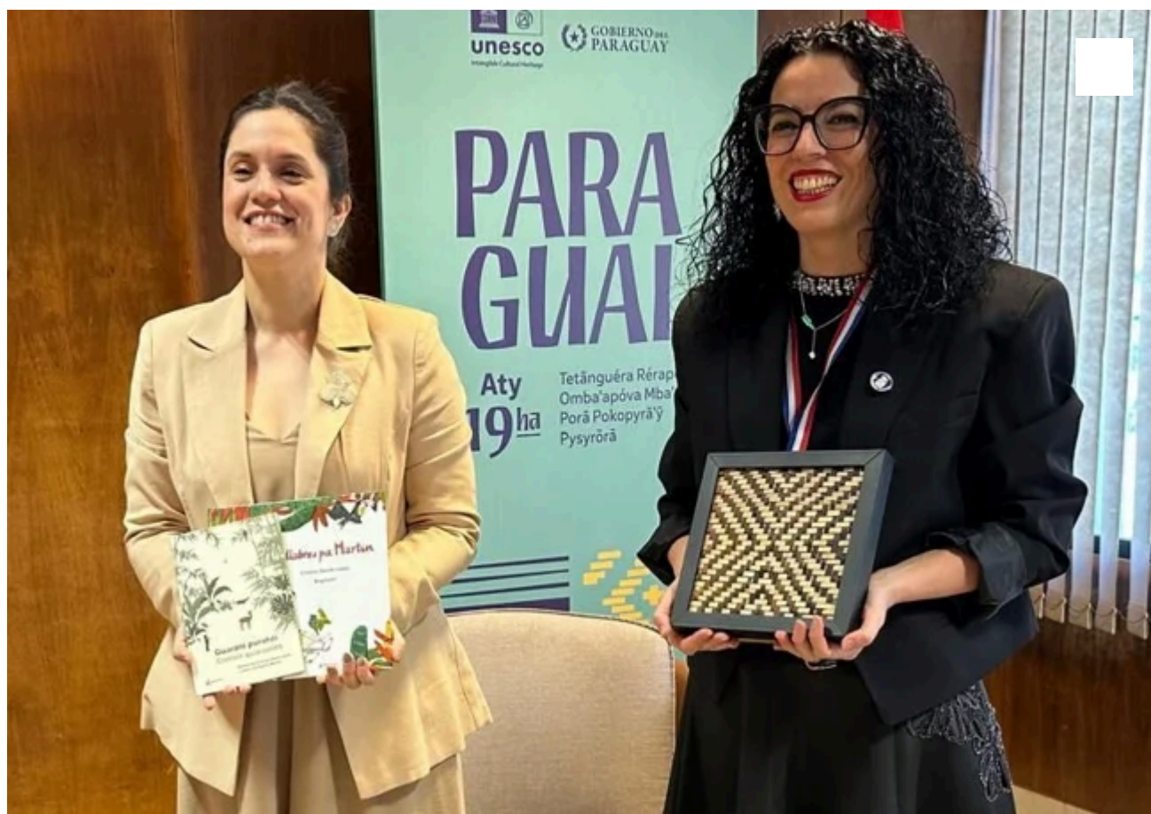
La ministra y la consejera, con sus regalos de cortesía.